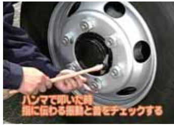
ホイールナット点検実技