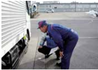
インストラクターとともに点検

新たに点検が義務付けられたホイール・ボルト関係をはじめ、日常の点検・交換やオーバーヒート処理など出先でのトラブル対処法も実地体験し、日常運転にお役立ていただけます。