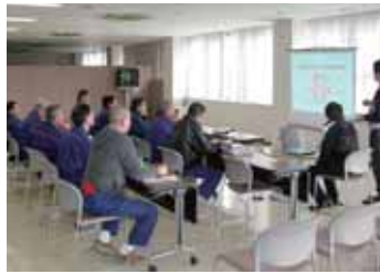
テキスト・ビデオによる座学風景