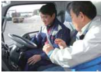
インストラクターによる実技指導